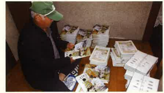
配布前に折りこみ準備をします

東海市の広報「とうかい」を各家庭へ配布するお仕事です。まずは配布の準備から。広報に同時配布するチラシやパンフレットを挟み込みます。広報が雨などで濡れないよう、配達する日の天気も確認します。